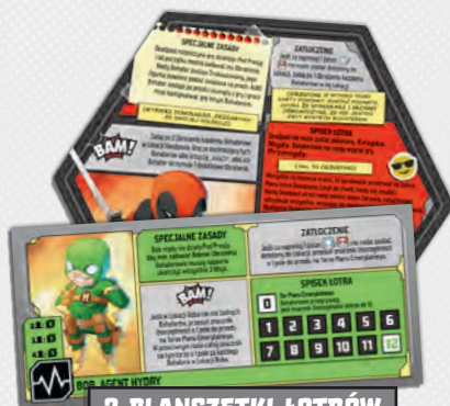
2 PLANSZKI ŁOTRÓW