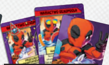
24 KARTY WARIACTW DEADPOOLA